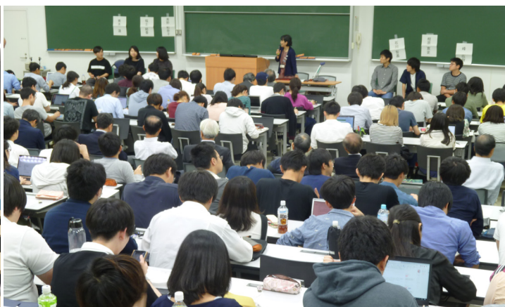
パネル Discussion「50 歳になった時、どのような街に住みたいか」