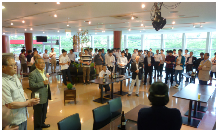
交流会の様子 (すずかけホール 2F, MOTOTECA cafe)