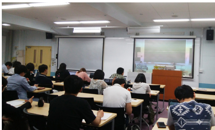
会場風景 (大岡山, S223 講義室)