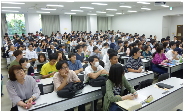
会場風景 (すずかけ台, J221 講義室)