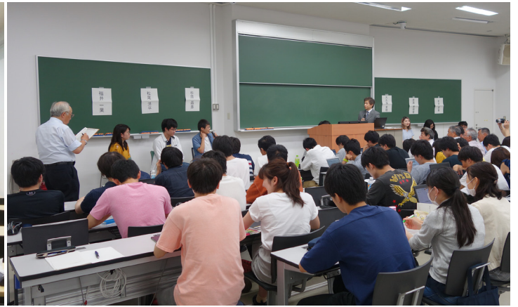
パネル Discussion「誰も成功したことがない開発を頼まれたら？」