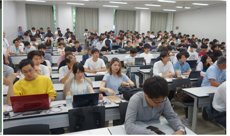
会場風景 (すずかけ台, J221 講義室)