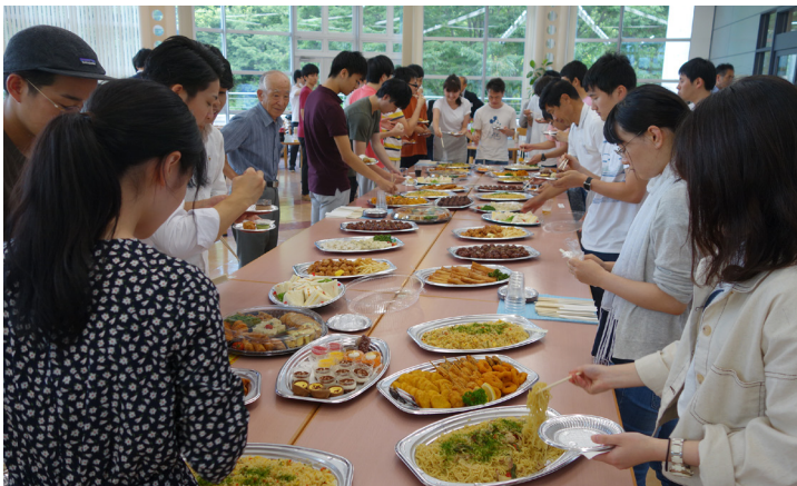
交流会の様子 (すずかけホール 3F, ラウンジ)