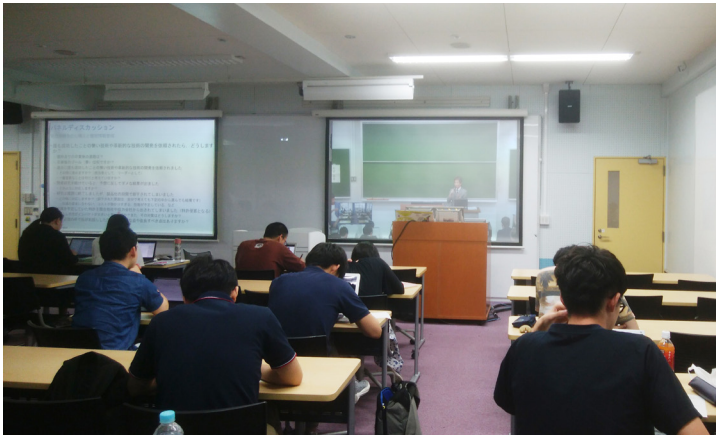
会場風景 (大岡山, S223 講義室)