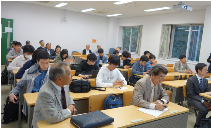
会場風景 (すずかけ台, J234 講義室)