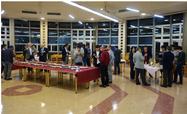
交流会の様子 (すずかけホール 3F, ラウンジ)