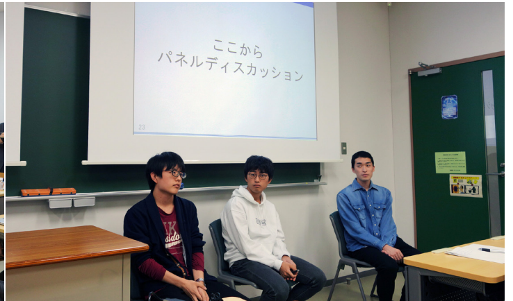
パネル Discussion「アンゾフのマトリックス…」