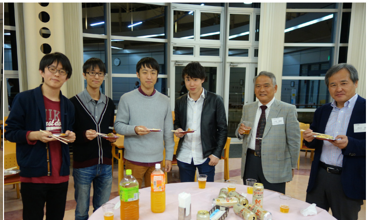
交流会の様子 (左から参加学生と小倉支部長・西江事務局長)