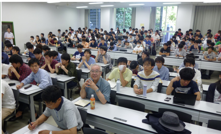
会場風景 (すずかけ台, J221 講義室)