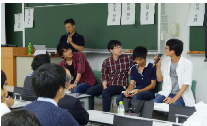
Panel discussion 「外資系企業のイメージと本当のところ-君は安定志向?」